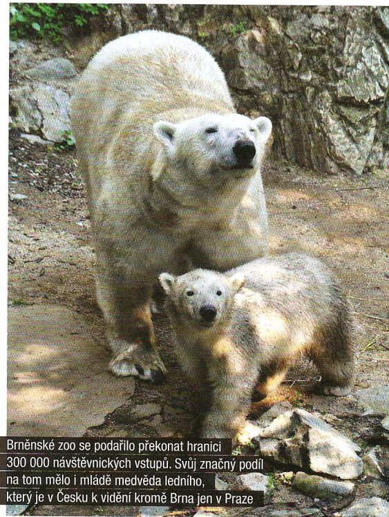
Brněnské zoo se podařilo překonat hranici 300 000 návštěvnických vstupů. Svůj značný podíl na tom mělo i mládě medvěda ledního, který je v Česku k vidění kromě Brna jen v Praze

Z vývojového pohledu lze říci, že po propadu zájmu o zoologické zahrady na počátku 90. let 20. století se návštěvnická čísla průběžně zvyšují. Zatímco v roce 1997, tedy před dvaceti lety, se součet návštěvností patnácti zoo v UCSZOO (tehdy UCSZ) zastavil na čísle 3 412 092, o deset let později (2007) se již jednalo o sumu ve výši 5 492 772 vstupů. Právě tehdy historicky poprvé zmiňovaný součet překročil magickou hranici pěti milionů a rekordní návštěvnost si do statistik zapsalo zmíněných sedm z patnácti zoo. Od té doby se návštěvnost vyvíjí ve vlnách s drobnými poklesy a vzestupy, stále však v pozitivní vývojové linii. Celkový rekord z roku 2007 byl v roce 2016 překonán již popáté.