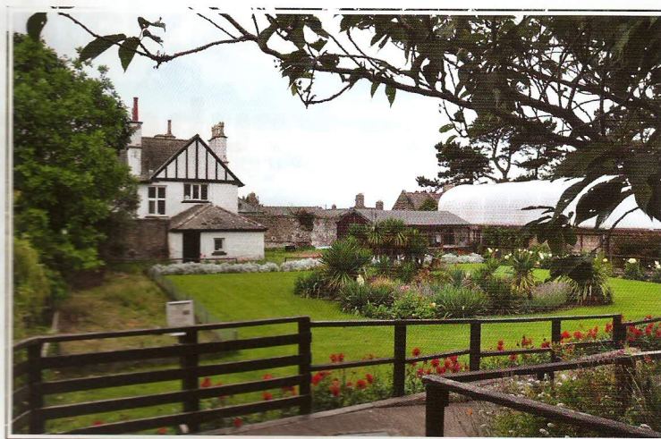
Udržovaný trávník, juky a jirínky ve spojení s historickou venkovskou architekturou

Těžiště zahrady se nachází ve venkovních expozicích, ale za zmínku stojí