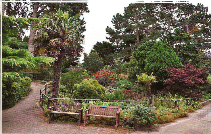
Centrální botanická „choreografie s gradací“ – nechybí vzrostlé dřeviny, ani keře a menší druhy trvalek

Nejzajímavější je pak část třetí – horní, rovinatá, jejíž počátky lze vysledovat mnohem hlouběji do minu-