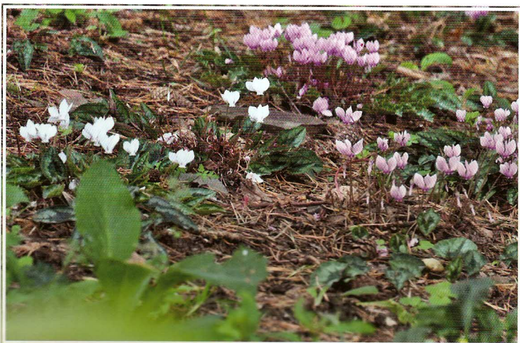
Bramboříky tvoří nádherné koberce

i dva menší tropické pavilony (pro aligátory a plazy) s broméliemi a exotickými druhy kapradorostů. V plánu je stavba velkého pavilonu tropů, kde by měla být současná kolekce ještě rozšířena. Závěrem snad ještě dodejme určitou lítost nad tím, že u zdejších