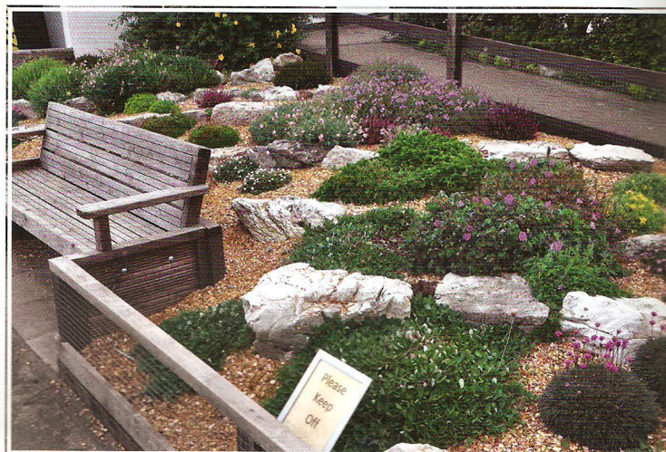
Skalkový záhon s trávničkami či vřesy dotváří prostředí u vyhlídkové kavárny a expozice tučňáků

Welsh Mountain Zoo byla nad přímořským letoviskem Colwyn Bay založena v květnu roku 1963. V současnosti tu můžete na ploše 15 hektarů obdivovat kolekci více než 500 živočichů ve 120 druzích a zároveň desítky druhů a kultivarů rostlin. Ročně si areál projde přes 150 tisíc návštěvníků a jistě na tom má podíl nejen pestrá škála chovaných zvířat, ale právě také nádherné zasazení do krajiny a květinová zákoutí. Zdejší zoo patří svým prostorovým rozložením k velkým unikátům – parkoviště