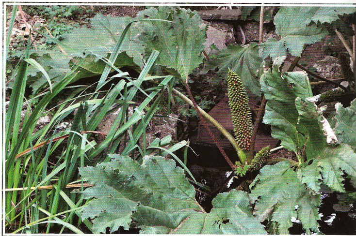
Barota čilská ( Gunnera tinctoria ) a její květenství v podobě půlmetrové laty

se totiž nachází v samém centru areálu. Kolem něj lze plochy rozdělit do tří zcela odlišných celků. Ty do jisté míry reflektují charakter celého Walesu.