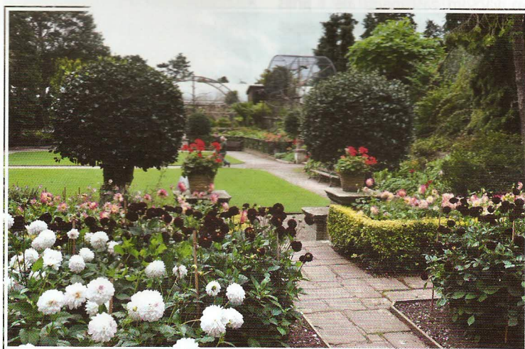
Mezi největší chloubu zahrady patří široký sortiment jirinek