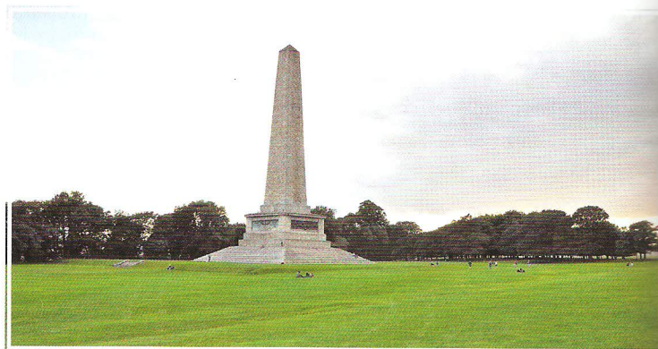
Pro Phoenix park jsou typická velká travnatá prostranství, mnohdy doplněná pozoruhodnými monumenty

Specifickou a velmi atraktivní částí Phoenix parku je dublinská zoo o rozloze 28 hektarů. Otevřena byla již roku 1831, tedy jako čtvrtá zoo na světě. Ročně sem v posledních letech zavítalo více než milion návštěvníků. Kromě několika set zvířat má areál co nabídnout i z hlediska botanického a zahradnického. Výsadba tu je velmi dobře promyšlena a navíc perfektně využívá jak tradičních zahradnických postupů, tak možnosti rozvoje „přirozené divočiny“. Zeleň je v tom nejlepší slova smyslu všudypřítomná a přes malou vzdálenost od centra na