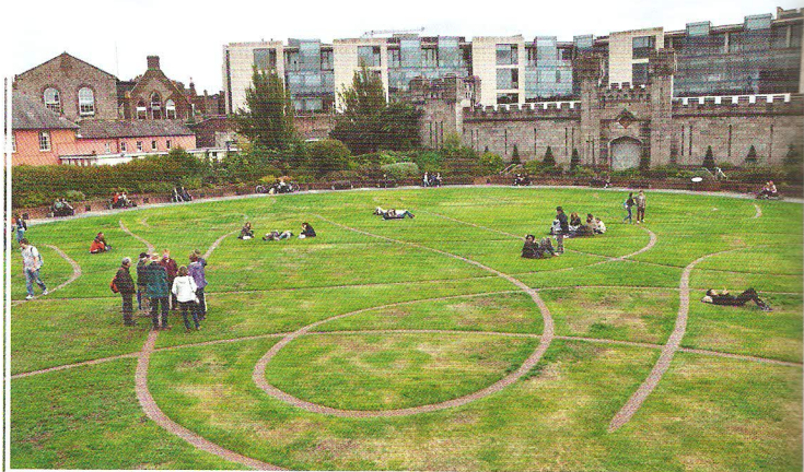
„Keltský“ parčík u dublinského hradu