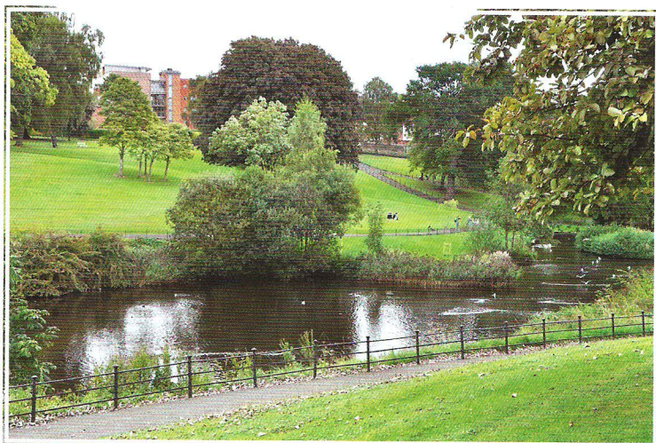
Phoenix park a jeho viktoriánská People's Flower Garden

vás dýchne opravdová příroda. Výběh goril je toho jasným důkazem – krom velkorysých rozloh vyniká divokostí, gorily mohou přirozeně lézt po vysokých živých stromech (dubech), od okolních expozic a cest je návštěvník oddělen bujnou vegetací. Právě tyto hodnoty se popisovaná expozice dostala jako vzorová ukázka i do odborných publikací.