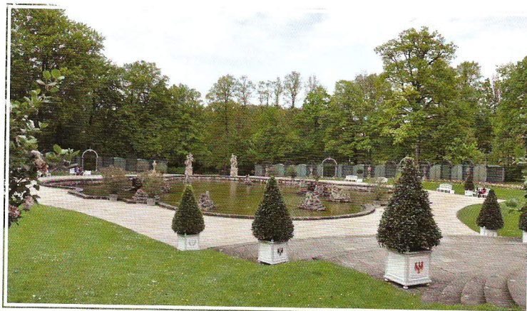
Eremitage – velká kašna s vodními hrátkami u nového zámku

podarilo díky značnému úsilí a nezanedbatelným investicím zrekonstruovat. Hlavní kompozici umocňuje velkolepá kašna (Obere Grotte nebo také Grosses Bassin) s vodotrysky a vodními hrátkami. Právě tento prostor tvoří středobod celého areálu Eremitage. O něco níže najdeme jinou vodní atrakci – Untere Grotte, která poutala návštěvy šlechty a láká i dnešní turisty. Tvoří ji velký bazén, 25 fontán a 13 vodních hrátek. Z města do Eremitage vedla a v určitém úseku stále vede lipová alej. Brána Parnass v podobě umělého skalního kopce tuto alej zakončuje. Kolmo vlevo pak cesta pokračuje habrovým tunelem ke starému zámku. Výjimečnost komplexu spočívá i v tom, že se tu během půl století intenzivních činností podařilo vytvořit architektonicky nesmírně bohatý a pestrý celek, jenž byl průběžně upravován tak, jak se měnila móda. Park nebyl vytvořen jednorázově, ale v relativně krátkém období ovlivněným řadou trendů. Eremitage tehdy získala podobu neobyčejného letního sídla, které při porovnání s Českou republikou nenachází konkurenta. Tři zámky a další více než desítku velkých architektonických děl, to jsou totiž parametry, jež v současnosti de facto nenacházíme ani v takových proslulých parcích, jako jsou Lednice či Vlašim.