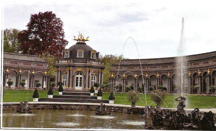
Eremitage – nový zámek s velkou kašnou a fontánou vodních hrátek

Velkolepý Nový zámek (Neues Schloss) vlastně ani zámek v pravém smyslu slova není. Středovému pavilonu se říká Chrám slunce (Sonnentempel) – na vrcholku kupole dominuje pozlacená kvadriga. Dvě navazující křídla sloužila a stále slouží jako oranžerie. V roce 1945 sice byla silně poškozena, nicméně se je