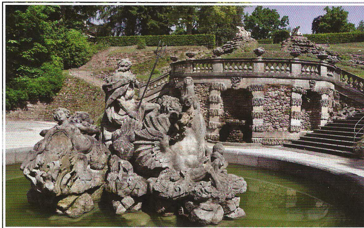
Fantaisie – Neptunova kašna a schodiště s kaskádami

Horní část areálu je rovinatá a disponuje květinovými záhony, užitkovou zahradou s ovocnými stromy i v nedávné době obnovenými loubími a samozřejmě vlastním zámekem. Ten je přístupný veřejnosti v podobě muzea zahradního umění (Gartenkunst-Museum), prvního svého druhu v Německu. Zachycuje vývoj německého zahradního umění zejména na příkladech parků 17. a 18. století z jižní části země. Stejně jako v areálu Eremitage, byly i zde obnoveny vodní hrátky, které jsou spouš-