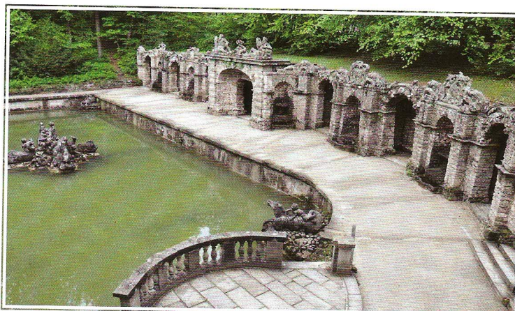
Eremitage – soubor vodních hrátek „Untere Grotte“