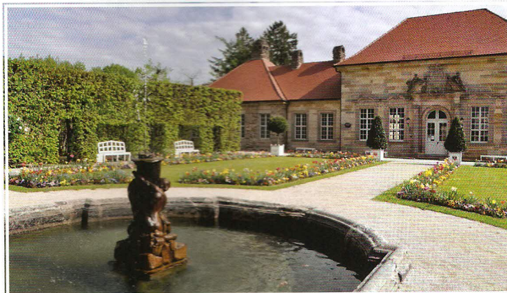
Eremitage – zahradní osa starého zámku

Devatenácté století je v Bayreuthu snad nejvíce spojeno s osobou Richarda Wagnera, hudebního skladatele, který tu žil v letech 1872 až 1879 a roku 1876 založil operní festival, pro nějž nechal postavit také velkolepou budovu. Tzv. Festspielhaus (tedy festivalové divadlo) i vlastní festival lákají milovníky hudby i běžné turisty do Bayreuthu dodnes a jistě k tomu přispívá i další z mnoha zdejších parků. Obrovské hrázdlené divadlo totiž obklopuje park Richarda Wagnera a umocňuje tak ojedinělou pozici na návrší na okraji zástavby města. Park se může pochlubit řadou květinových záhonů i uměleckých děl, z nichž některá odkazují na kontroverzní