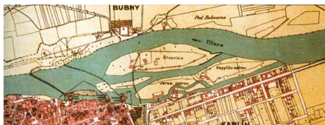
Obr. 2: Skupina zaniklých ostrovů u Štvanice v polovině 19. století (Primátorský, Jeruzalémský, Papírnický, Kamenský, Köpplův = Rohanský).

Cílem článku je na konkrétním příkladě (pražské vltavské ostrovy) ukázat, jak je možné velmi stručně a výstižně (pomocí klíčových slov) sestavit podklad pro diskusi, vyprávění, prezentaci míst, která nás zaujala. Strana 2 a 3 je koncipována jako plakát, který formou tabulky seznamuje s důležitými údaji a událostmi, je doplněn historickými a současnými fotografiemi opatřenými krátkým výstižným textem (nejen popis objektů na fotografii, ale také jejich charakteristika a zasazení do širších souvislostí). K sestavení obdobného materiálu je třeba využít nejen zdrojů různého typu, ale vyzkoušet si i odlišné metody jejich získávání. Informace o místech můžeme získat z literárních pramenů, kam patří nejen vědecké (Wirth 1948, Semotanová 1995) a populární články, ale i beletrie, kroniky, informační letáky apod., z vyprávění pamětníků, ze starých legend a pověstí, z fotografií (Wirth 1948, Sitenský 1989), pohlednic, či map (obr. 2, 3). S obyvateli i návštěvníky míst můžeme provádět rozhovory, dotazníková šetření a zjišťovat, jak místa vnímají, proč a jak často je navštěvují,