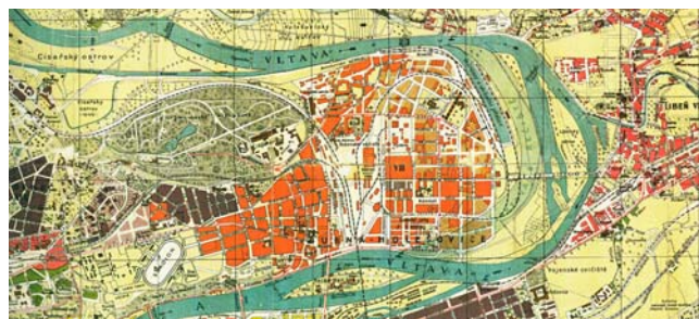
Obr. 3: Území Libně a Holešovic na mapě Prahy z roku 1923 před úpravami řečiště Vltavy. Na jihu patrný Karlínský přístav, na severu Císařský ostrov při jižním břehu lemovaný nově vybudovaným Trojským kanálem. Zdroj: Hrubeš, Hrubešová 2007

Poděkování: Článek vznikl v rámci projektu GAČR P410/12/G113 Výzkumné centrum historické geografie.