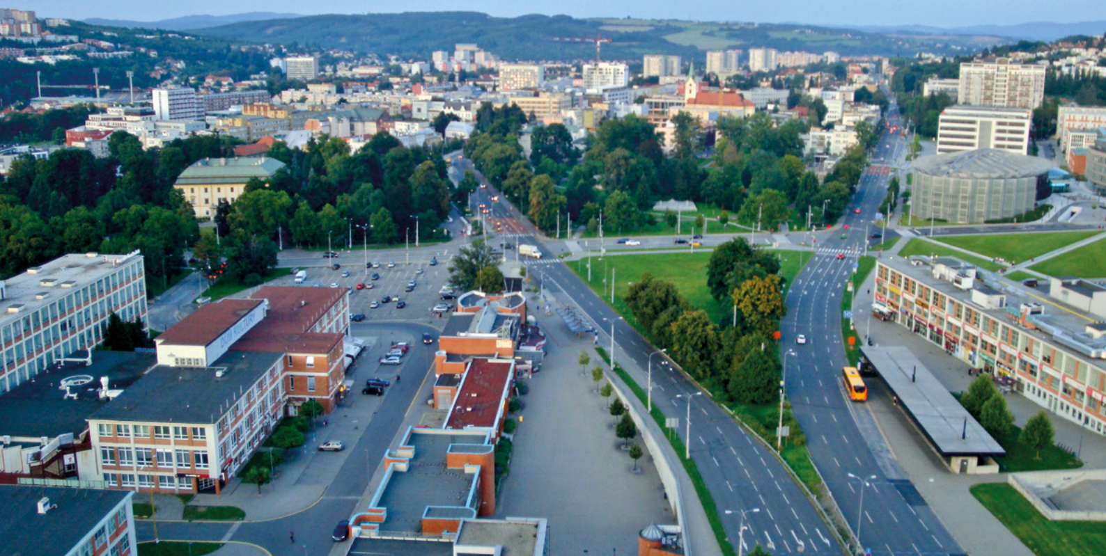
...a nyní (2021)