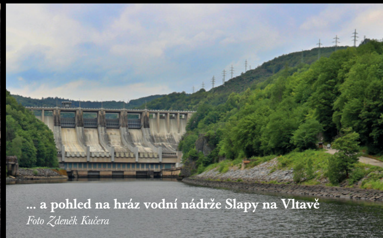
... a pohled na hráz vodní nádrže Slapy na Vltavě