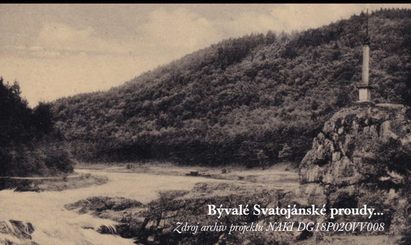
Bývalé Svatojánské proudy...