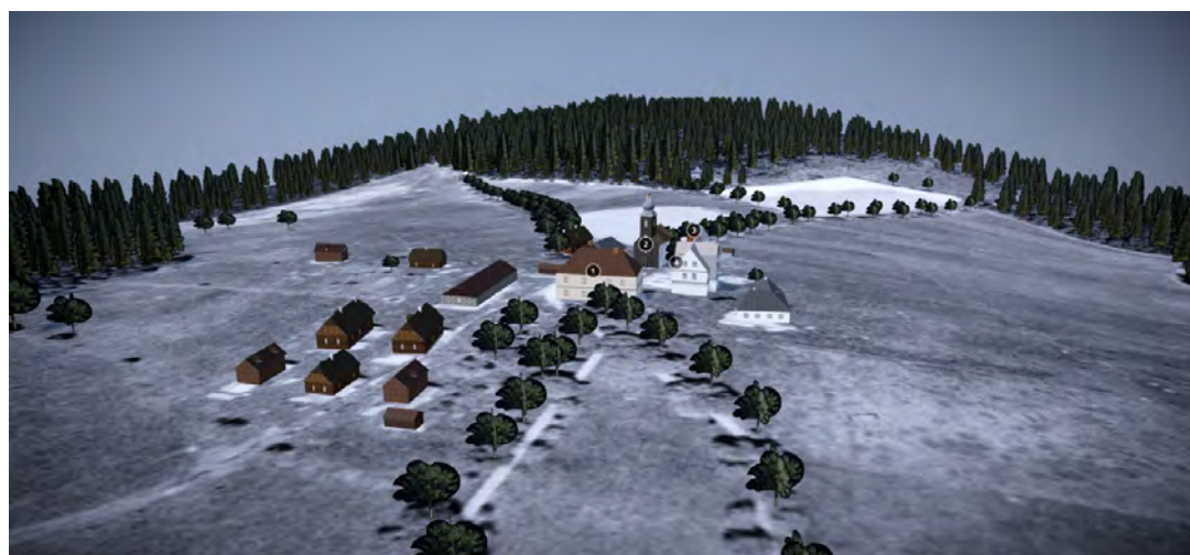
OBR. 4 3D fotorealistický model zaniklé osady Hůrka (40. léta 20. století) – celkový pohled (modelováno v programu Sketchfab).

Orná půda pokrývala podle údajů z naší databáze více než 6 % území (dnes je její rozloha nulová) a trvalé travní porosty (louky a pastviny) zaujímaly celou čtvrtinu území (dnes pouze necelých 9 %). Podíl zástavby byl sice jen 0,1 %, v současnosti je to dokonce pouze 0,03 %. Krajina tedy prošla významnou extenzifikací, ornou půdu a trvalé travní porosty nahradily lesy. Ty se v 1. polovině 19. století rozkládaly na dvou třetinách území, dnes ho pokrývají z 90 %. Podíl lesa, který tvoří krajinnou matici, se zvýšil zejména v poválečném období (po vysídlení Němců a vzniku železné opony) a v krajinném pokryvu území významně převládá. Řada přírodně hodnotných ploch lesa i bezlesí se nachází v 1. bezzásahové zóně národního parku. Ani na ostatním území není hospodaření intenzivní a v lese se uplatňuje jeho přirozená obnova. Smrkové monokultury