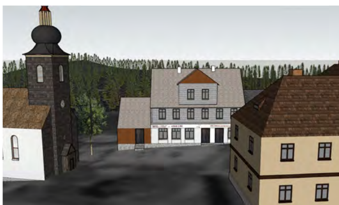
OBR. 1 Srovnání fotografie a modelu (osady) Hůrka, v popředí kostel sv. Vincence a hotel U Jezera Laka. (Obrázek vpravo je výstupem z programu SketchUp Pro.)

V místech, kde stávala Hůrka, se dnes nacházejí louky, bývalé osídlení a kulturní krajinu připomíná jen opravená kaple a chráněné stromořadí 116 javorů a lip (Hůrecká alej). Na kapli je umístěna tabule informující o historii obce a pamětní deska obětem zabitým v období komunistického režimu při státní hranici na Šumavě. Okolní louky jsou z menší části sklizené na seno nebo vypásané ovce, z větší části leží ladem a podléhají samovolné sukcesi. Postupně tak zarůstají dřevinami a mění se v les. Na četných zamokřených plochách je ale sukcesní vývoj a zarůstání dřevinami pomalejší, a zůstávají tak převážně jako plochy bezlesí.