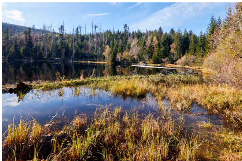
OBR. 5 Jezero Laka a okolní lesy poškozené kůrovcem na Prášílsku (2019).

byly počátkem 21. století katastrofálně zasaženy orkámem Kyrill (2007) a kůrovcovou kalamitou, na celém území však dochází k přirozené obnově jak smrkového, tak i smíšeného lesa. Rozsáhlé zbytky starých bukojedlových porostů v okolí v nadmořské výšce kolem 900–1000 m s přirozenou obnovou buku a jedle dokazují, že Šumava nebyla a nemusí být ani v budoucnu jenom smrková. Na plochách bývalých střelnic převládá nálet pionýrských listnáčů, jako je bříza, osika a jívka, na vlhčích místech olše a vrby, v jejich podrostu se ale uplatňuje i smrk.