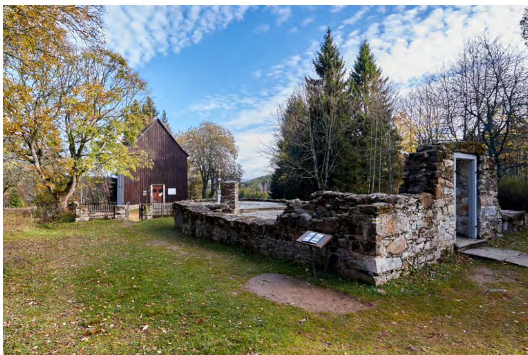
OBR. 2 Hřbitovní kaple sv. Kříže a zbytky kostela sv. Vincence v zaniklé osadě Hůrka (2019).

V Prášilech dnes žije asi 150 obyvatel. Obec Prášily je s katastrální výměrou 112,28 km 2 největší obcí v Česku, která není městem. Obec nemá školu ani kostel, ale po 40 letech se opět stala významným centrem zimní i letní rekreace. V Prášilech funguje několik penzionů, restaurace, cukrárna, byla obnovena chata Klubu českých turistů. V obci je informační středisko, byly vyznačeny četné