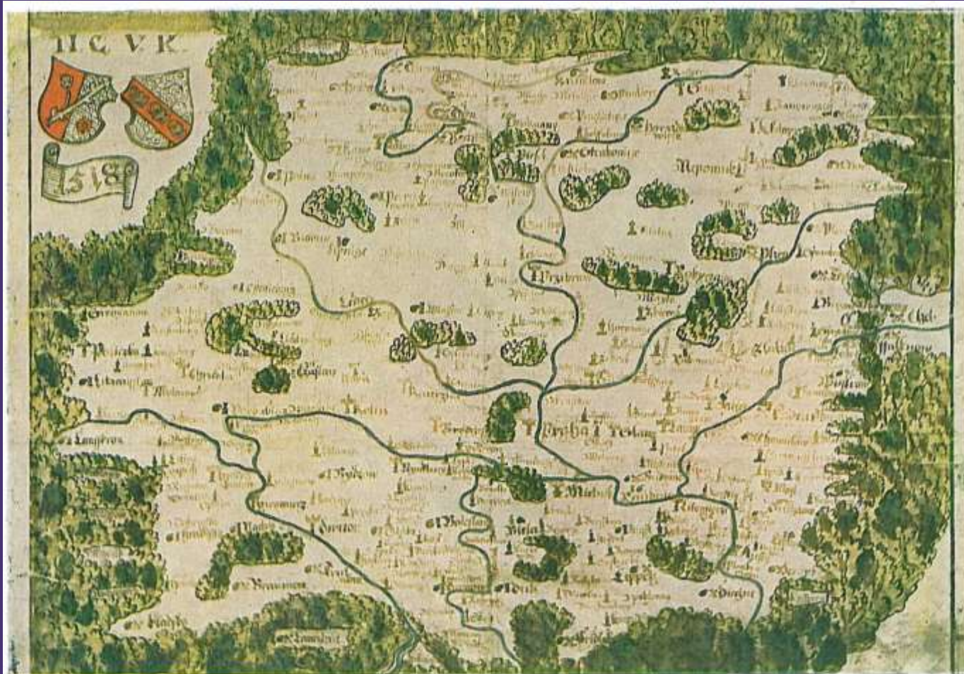
Rukopisná kopie Klaudyánovy mapy z 16. století (t. zv. rychnovský exemplář)