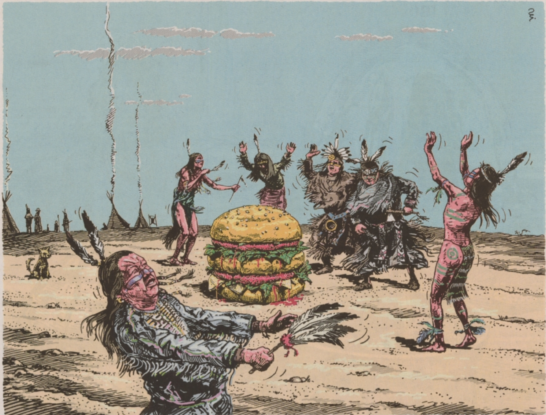
Dokončení ze strany 21

Semiperiferie je přechodnou oblastí se smíšenými znaky jádra a periferie.