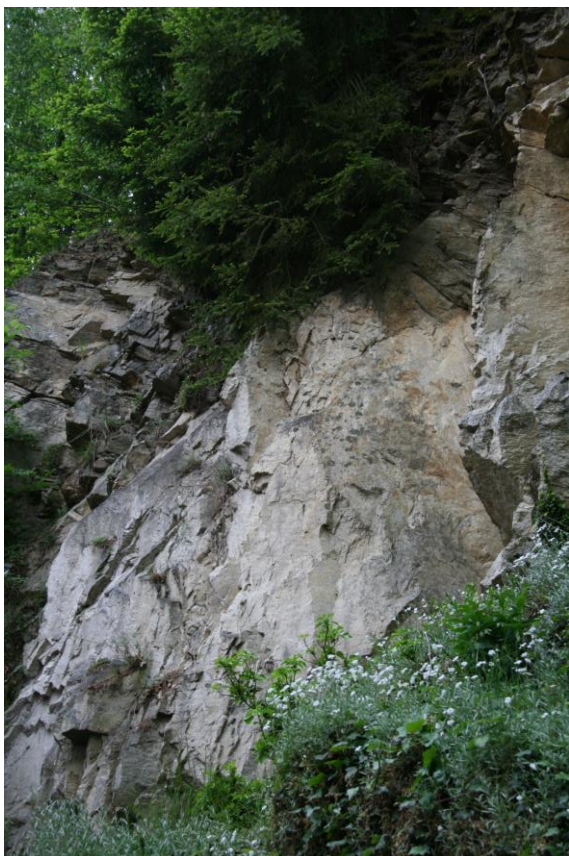
Lok. č. 4: Perlové ruly a migmatity gföhlské jednotky moldanubika jv. od Čeřenic (čeřenické migmatity). Bt a grt-biotitické,