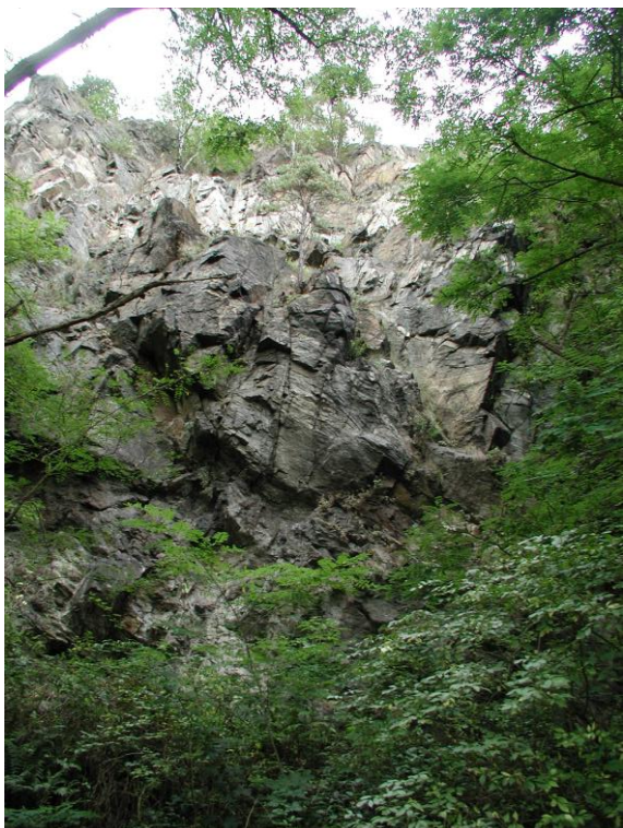
Lokalita č. 14: Vrásy v migmatitech gřöhlské jednotky moldanubika (z. část pýskočelského menadru přechod z plochých do strmých foliací v blízkosti tektonického kontaktu s bohemikem (středočeským plutonem). sz. od Sázavy n. Sázavou