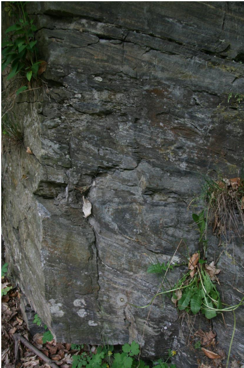
Izoklinální vrásy v sill-bt pararulách výchozy u parkoviště hradu Český Šternberk- pestrá skupina moldanubika

1. lok. Český Šternberk – pararuly s polohami krystalických vápenců, erlánů, směrem k severu vložky amfibolitů.