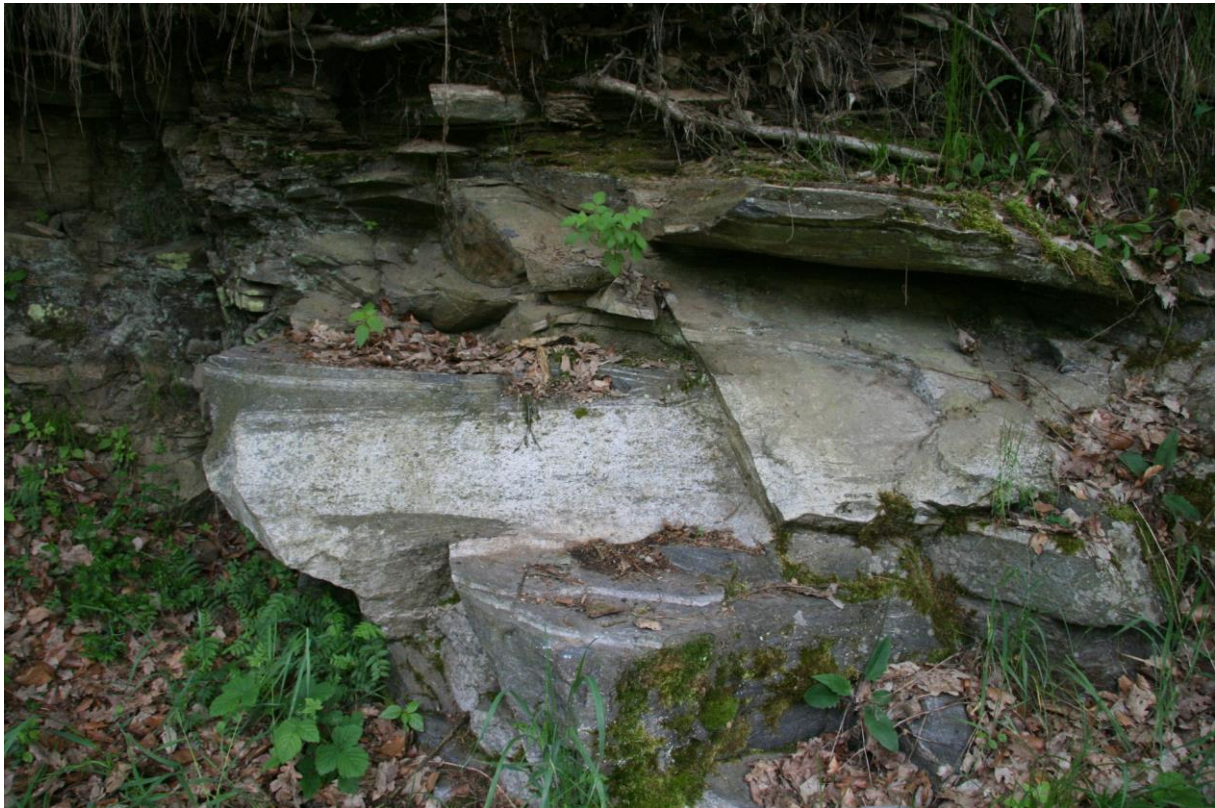
Lokalita č. 5. Grt-kyanit-btt svorové ruly ratajské zóny, místy retrográdně postižené muskovitizací a chloritizací (viz mikrofoto v powepointové presentaci). Rataje n. Sázvou u žel. mostu k nádraží Rataje.