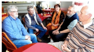
redakční rada Kruhu