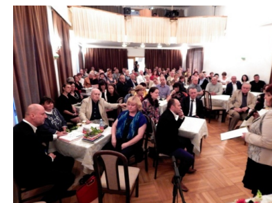
aktéři vernisáže a hosté