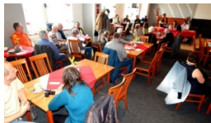
pohled do sálu Philadelphie