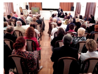
pohled do sálu Zámku