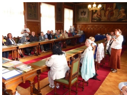
pohled do historického sálu radnice