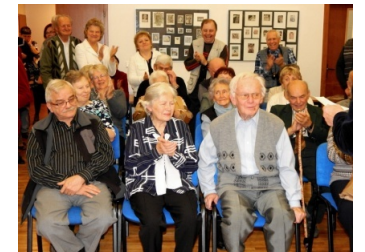
nálada byla skvělá