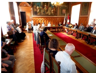
pohled na předsednický stůl