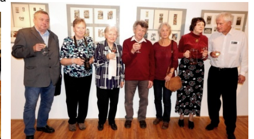
přátelské setkání sběratelů