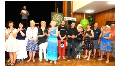
Defilé přítomných výtvarníků