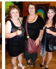
mal. M.A.Havránková, mal. P.Jonesová