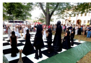
Taneční představení ZUŠ