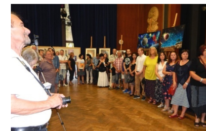
Pokračování defilé výtvarníků