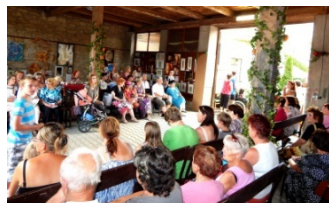
Přítomní výtvarníci a hosté