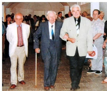
Vernisáž výstavy v Lanškrouně *