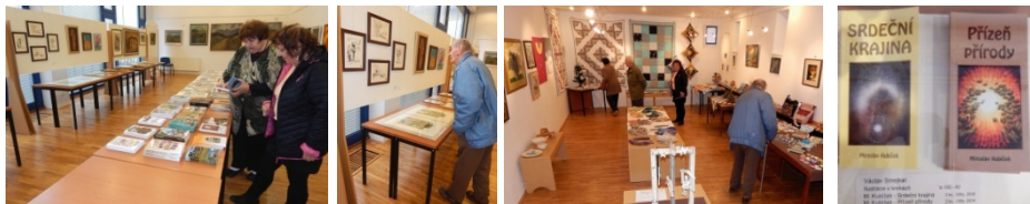
Prodejní výstava KPU 2017 byla zahájena bez vernisáže

na letošní Vánoce. Obrazy, grafiku, plastiky, fotografie, patchwork, knihy, betlémy a jiné díla. Pro JMB to byla výstava s pořadovým číslem 90.