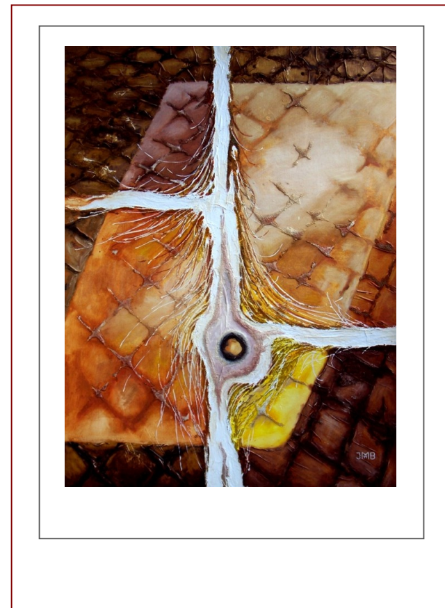
Kompozice 1 (olej, 160x120 cm) Composion 1

Art – Vernisages - Exhibitions – Auctions – News – Meetings malíře, grafika a ilustrátora Ing. Václava Smejkala