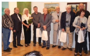
defilé skupiny Triangl