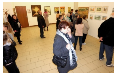
expoziční v přízemí