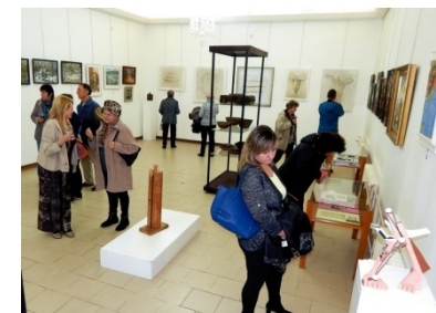
expoziční v patře