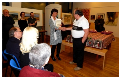
představování jednotlivých autorů