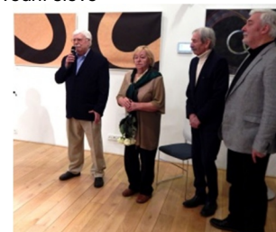
bratři Rosákoví a manželka