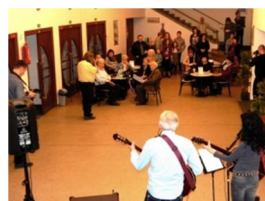
hudební skupina SVM band