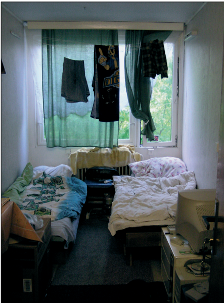
Typický příklad pokoje na ubytovně: dvoulůžkový pokoj, kde ukrajinští dělníci tráví čas po práci. Sociální zařízení a kuchyňka jsou na patře, parkoviště za ubytovnou.

Podíly Ukrajinců na obyvatelstvu okresů a jejich počty v okresech v roce 2005 (národnosti s více než 4 000 občany v Česku)